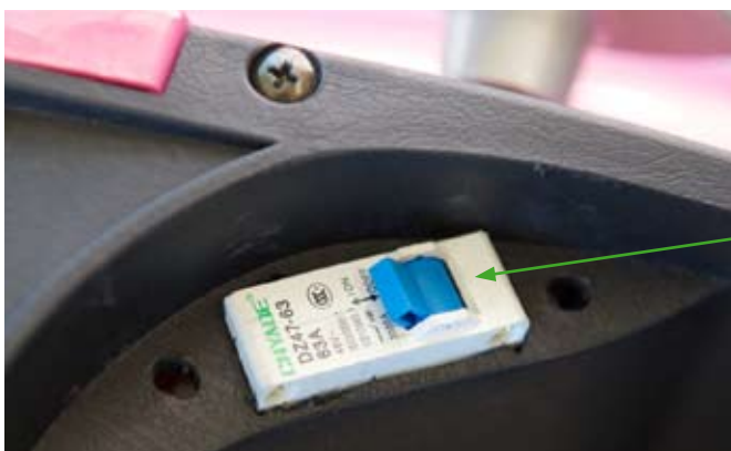
HUVUDSTRÖMBRYTARE UNDER SADLEN