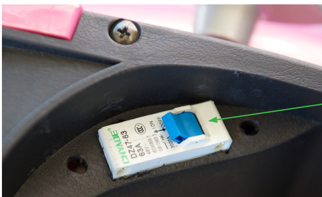
HUVUDSTRÖMBRYTARE UNDER SADLEN